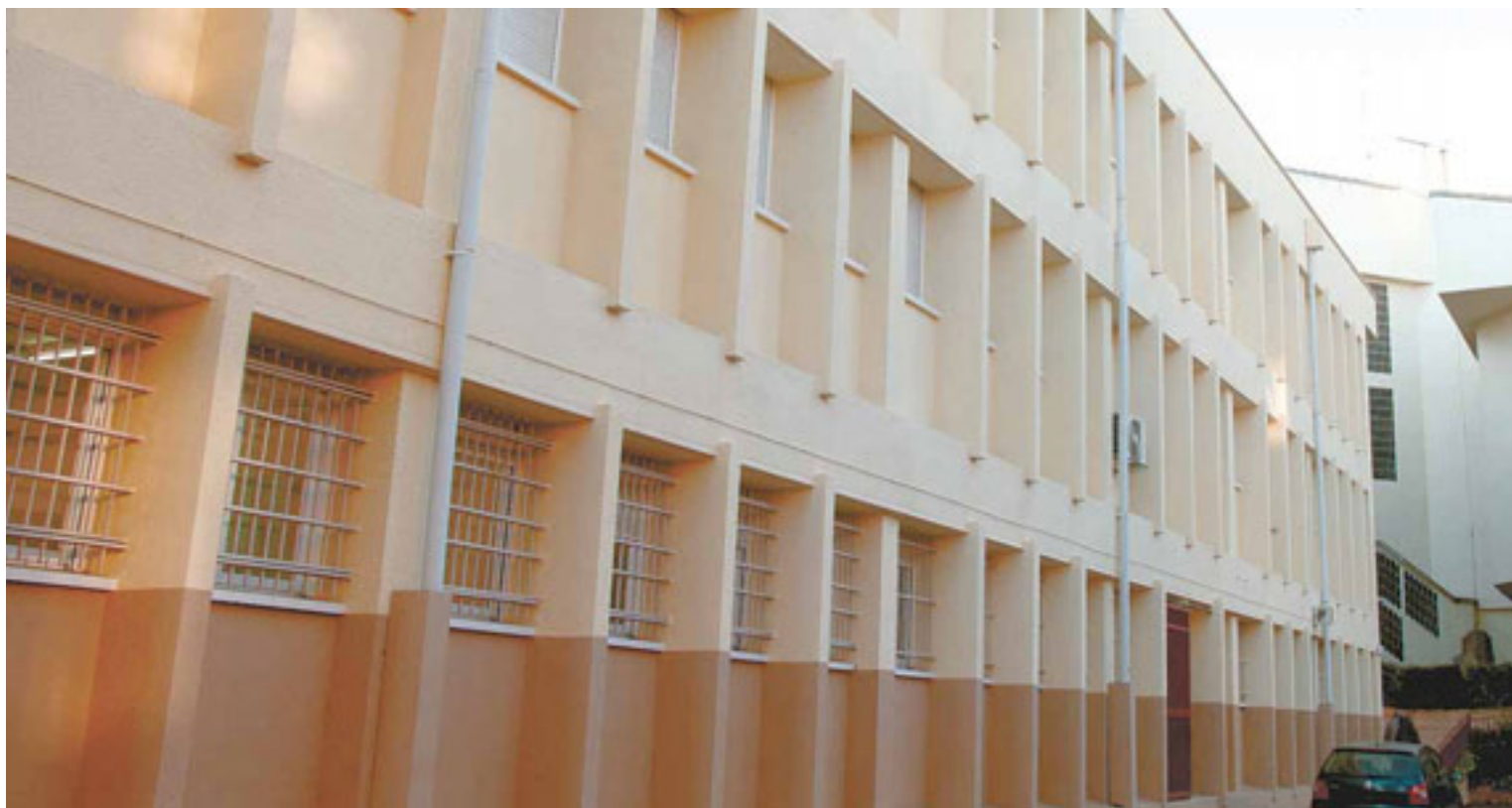
El IES "Renacimiento" se ubica en el madrileño barrio de Carabanchel. JORGE ZORRILLA

RODRIGO SANTODOMINGO Enclavado en el castizo barrio de Carabanchel, el IES "Renacimiento" se alza como una secuencia de enormes edificios en cuña salpicada de canchas deportivas y naves para enseñanzas profesionales. En el recinto, que acoge a más de 1.600 estudiantes, abunda el hormigón y escasean los árboles. El centro ofrece el surtido completo de estudios de Secundaria: ESO, Bachillerato y un buen puñado de familias de FP. Su alumnado, como en la mayoría de institutos del sur de Madrid, resulta de lo más variopinto, con un alto porcentaje de hijos de inmigrantes y elevadas tasas de chavales que precisan de algún tipo de actuación compensatoria. El origen humilde de las familias se antoja, quizá, el nexo de unión que aglutina al cuerpo estudiantil.