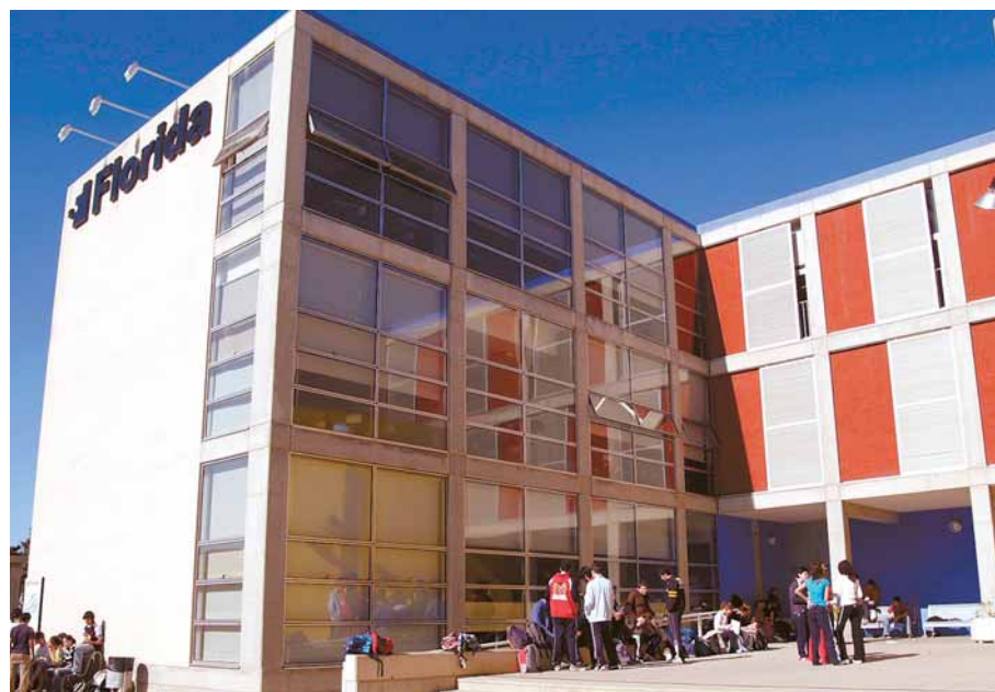
Vista general de “Florida Centro de Formación Cooperativa Valenciana”.

La directora de FP dual en Bankia desglosa tres conceptos que ayudan a comprender el trasfondo pedagógico del nuevo ciclo: modelo integrado (“integra conocimiento para convertirlo en competencias”), innovación aplicada (“a la cotidianeidad formativa”) y emprendimiento activo (“trabajaremos con los alumnos habilidades comunicativas y organizativas que le van a permitir tener iniciativa propia, ser líderes de su propio trabajo”).