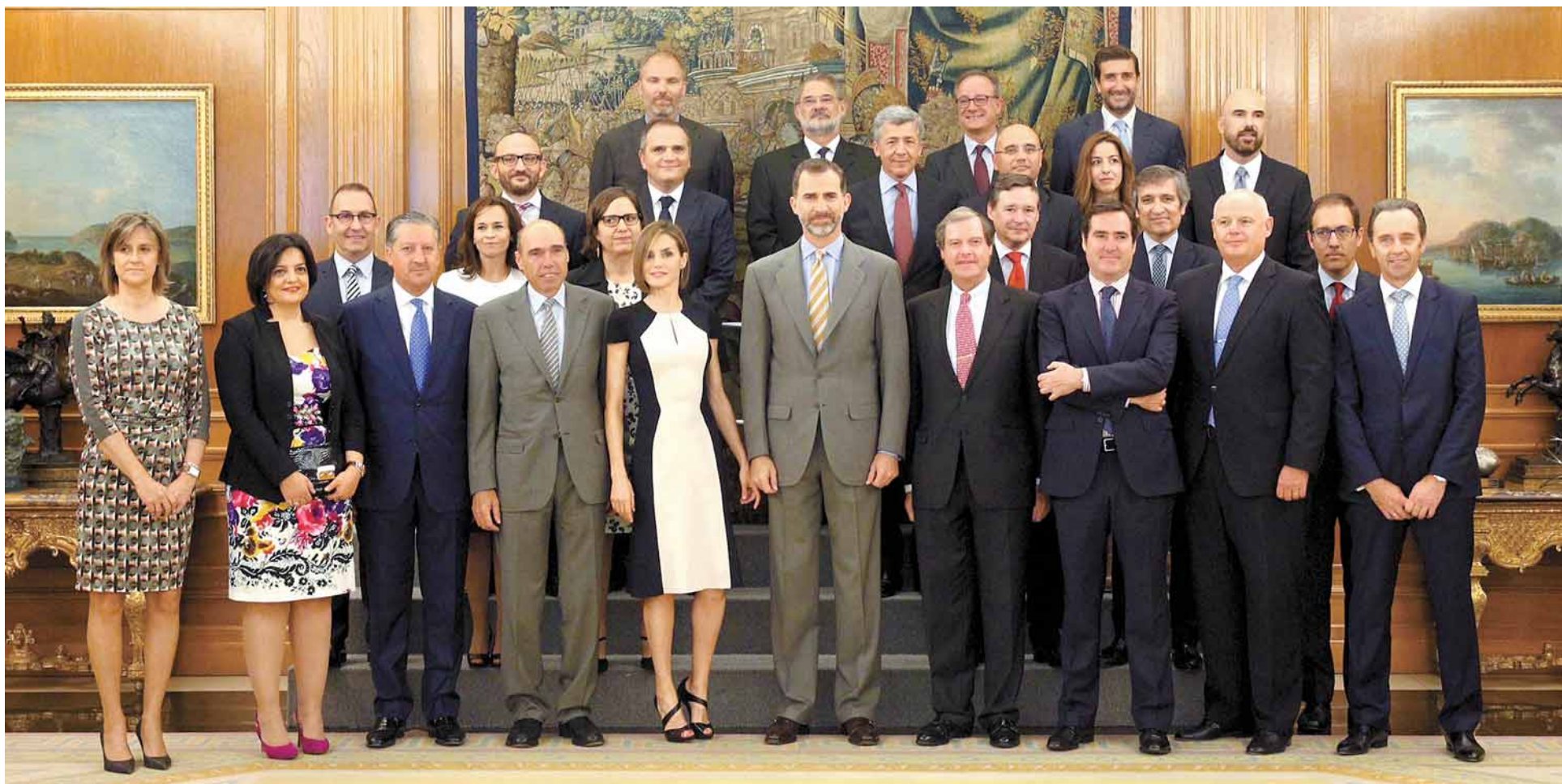
Los reyes de España recibieron en audiencia a los promotores de la Alianza para la Formación Profesional Dual.

RODRIGO SANTODOMINGO La Educación española ofrece un panorama de contrastes. A un lado del espectro, posee una tasa de licenciados universitarios que la sitúan en los primeros lugares entre los países del mundo desarrollado. Al otro, arroja índices de fracaso y abandono escolar temprano que, por desgracia, también suponen cifras récord.