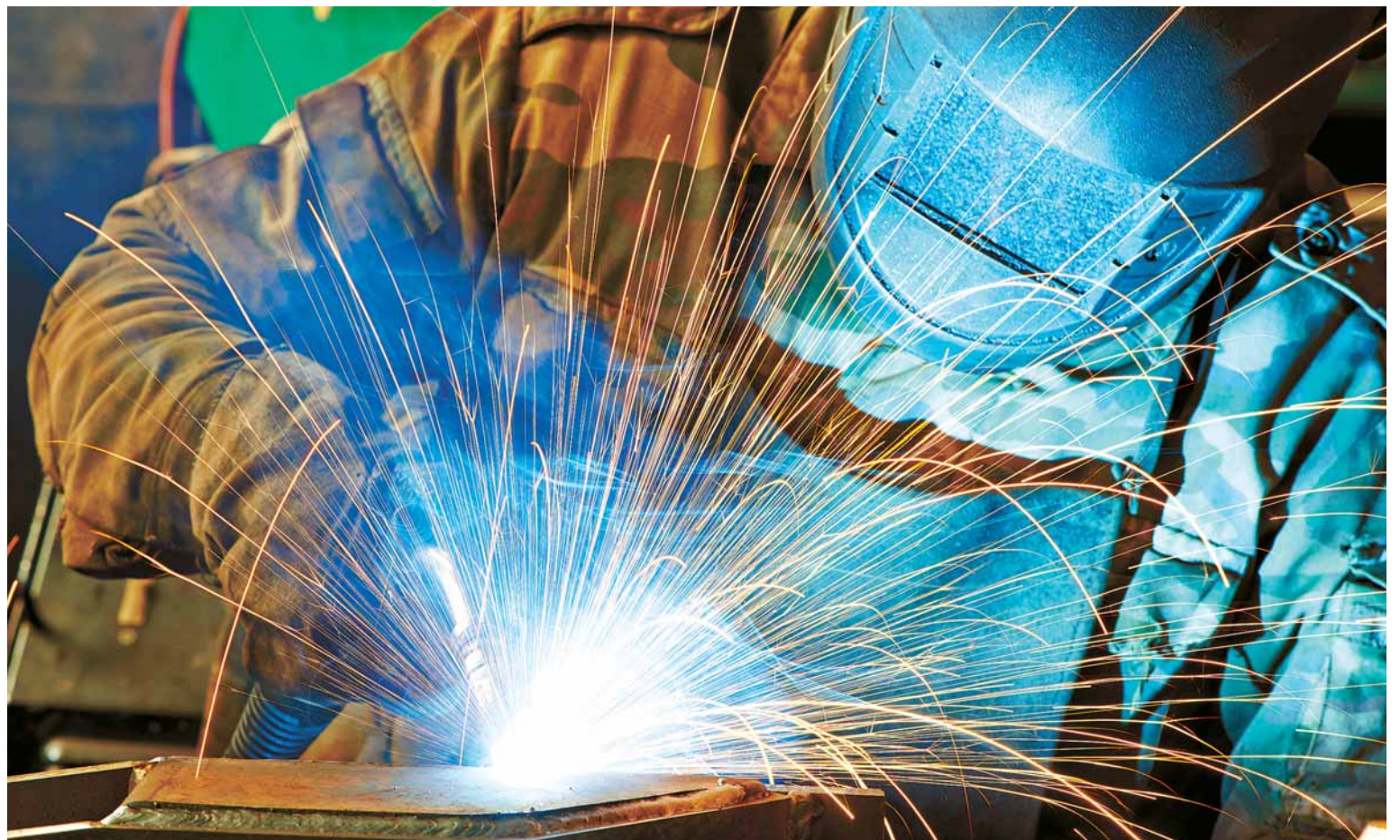
Los ciclos industriales adolecen de falta de demanda por parte de los alumnos.

Además, algunos orientadores y docentes son víctimas de su falta de información y, en ocasiones, de sus ideas caducas sobre qué espera al alumno durante su formación y tras una hipotética contratación. Esto se hace especialmente evidente en el ámbito industrial, donde las circunstancias y entornos laborales han cambiado