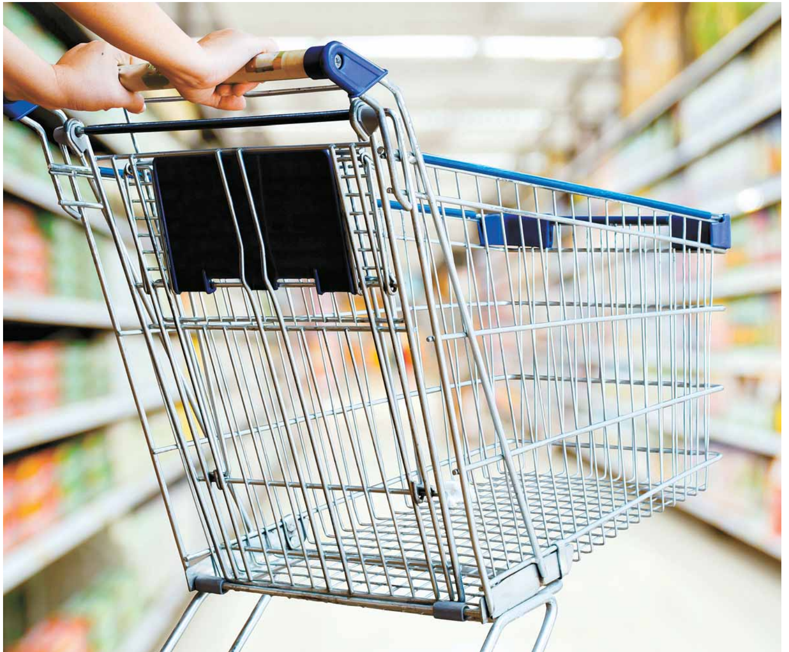
Las empresas de supermercados encuentran dificultades para cubrir sus plazas de dual.